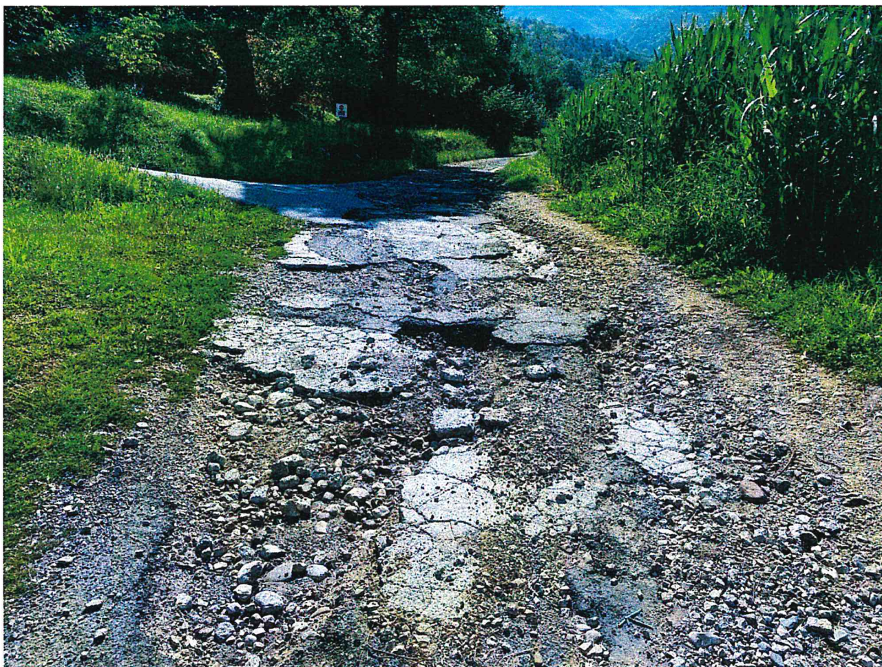
Strada Località Prael