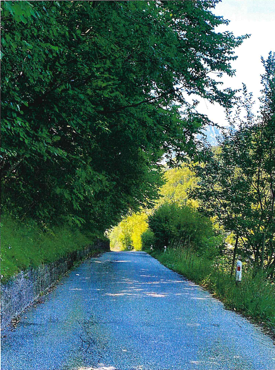
Via dei Vespiai – Direzione Madonnina