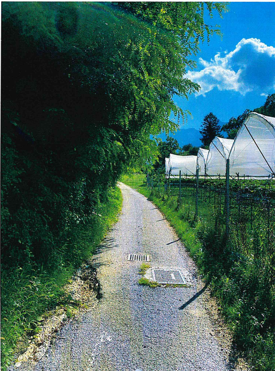
Strada Località Prael