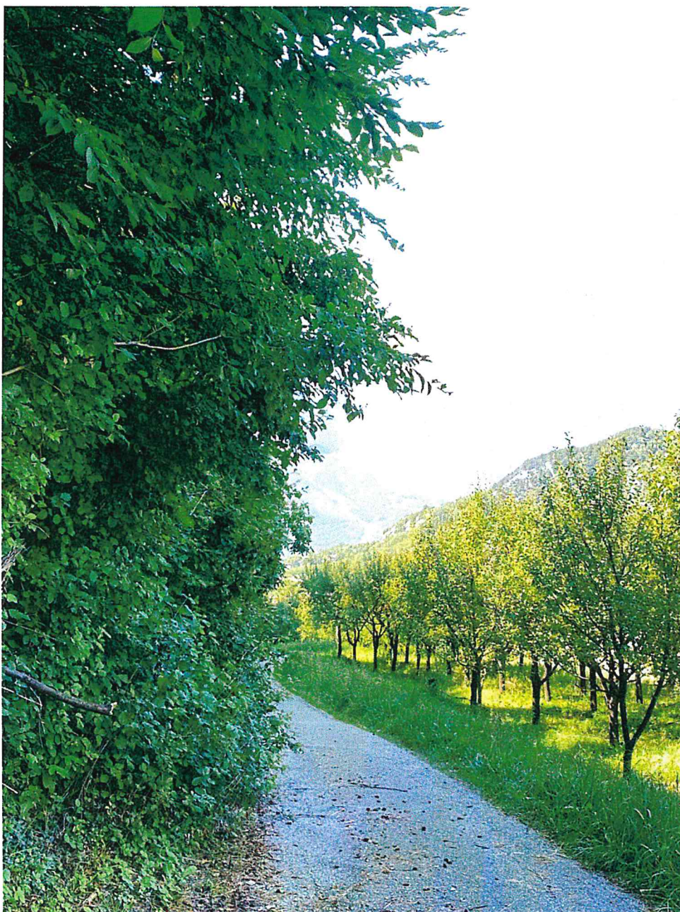
Strada delle Crone